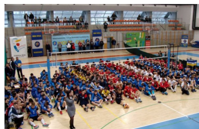
Uczestnicy turnieju młodzików na otwarciu w hali Koło

Fotogalerię z otwarcia turnieju i z sobotnich gier można