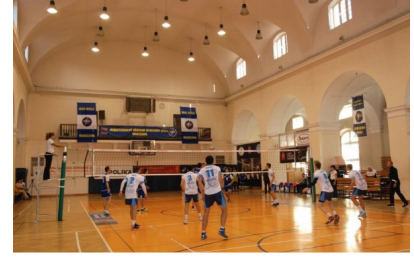
Juniorzy MOS II Wola w czasie meczu w hali przy Rogalińskiej

Po meczu pierwszego zespołu juniorów do swojego meczu w II lidze mazowieckiej przystąpili siatkarze drugiego zespołu juniorów MOS Wola, który jest oparty na młodszych zawodnikach z rocznika 1997.