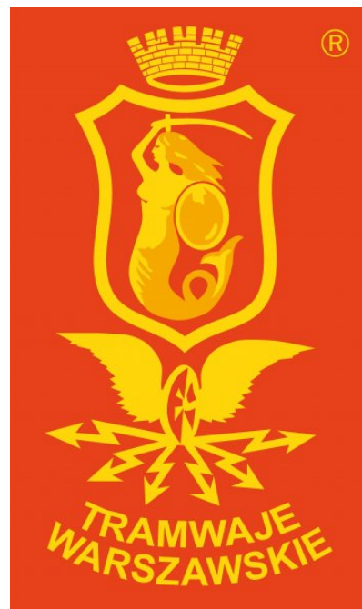
Tramwaje Warszawskie - główny sponsor naszej drugoligowej drużyny siatkarzy

https://www.facebook.com/media/set/?set=a.653703271355238.1073741930.138726976186206&type=1