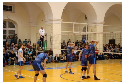
Mecz z Hajnowką o pierwsze miejsce w II lidze oglądał w hali przy Rogalińskiej nadkomplet publiczności.