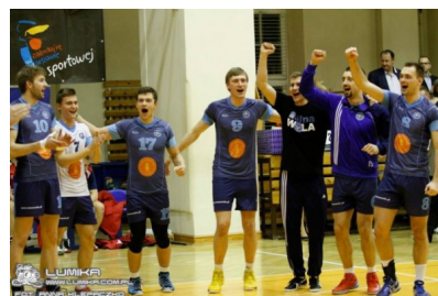
Radość siatkarzy MOS Wola po wygranej z Hajnowką.

SKS Hajnowka: Rafał Kuźma, Artur Żyliński, Łukasz