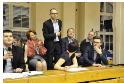
Goście na meczu. Prezentowany jest publiczności Poseł na Sejm Rzeczypospolitej, Michał Szczerba