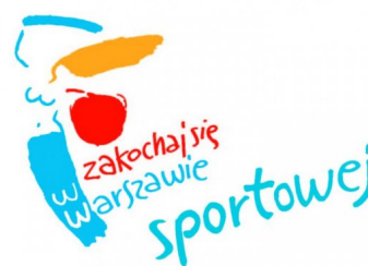
m.st.Warszawa wspomaga nasz zespół siatkarzy w II lidze mężczyzn