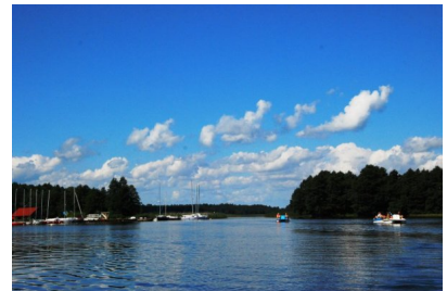
Wycieczka po jeziorze Stręgiel.

https://www.facebook.com/media/set/?set=a.552918544767