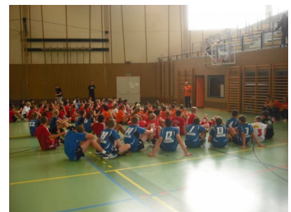
Uczestnicy zawodów na otwarciu 40. Turnieju klubu Sokol