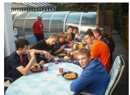
W czasie posiłku w trakcie turnieju