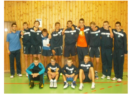
Drużyna MOS Wola na turnieju w Wiedniu