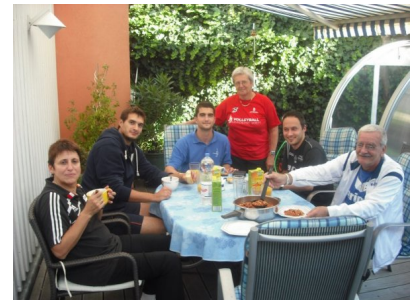
Trenerzy MOS Wola z trenerami drużyny hotvolleys Wiedeń