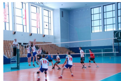
Jeden z trzech meczów sparingowych, które rozegrali siatkarze MOS Wola w Berlinie