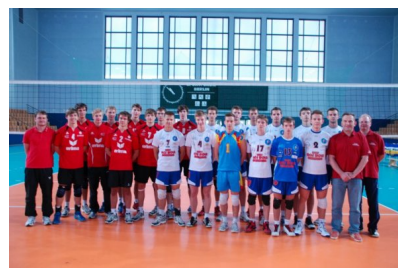
Wspólne zdjęcie drużyny Szkoły Mistrzostwa Sportowego z Berlina (VTO Zurich Berlin) i MOS Wola Warszawa