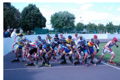
Na terenie kompleksu sportowego Sportforum nasza ekipa spotkała takich oto sportowców.