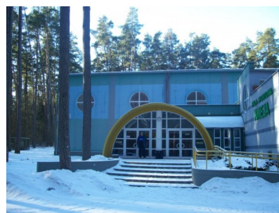
Wejście do ośrodka "Knieja" w Rajgrórze