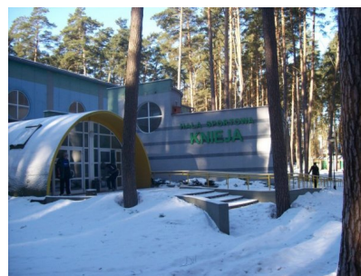
Rajgród - ośrodek w którym przebywają młodsi kadeci MOS Wola

Pozostałe grupy trenują w Warszawie w hali MOS-u przy ul. Rogalińskiej.