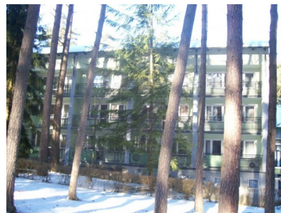
Zima 2011 w Rajgradzie, ośrodek w lesie.