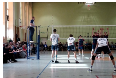
Trzeci mecz, trzecie zwycięstwo. Z Metrem 3:0