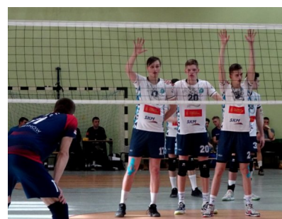
Mecz z Metrem wygrany bardzo wysoko 3:0