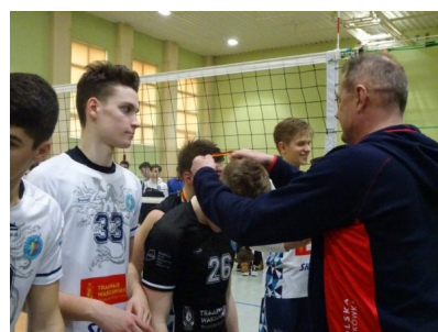
Złoto, złoto, złoto