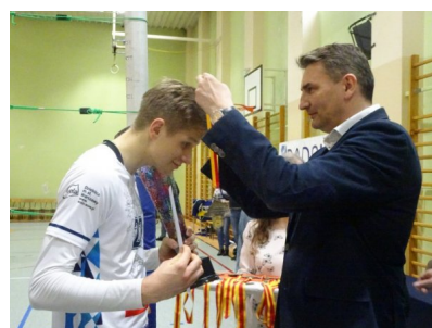
Medale, złoto dla MOS Wola