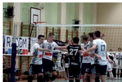
Drużyna juniorów MOS Wola w meczu z Czarnymi Radom

Wśród czterech zespołów walczących o medale, aż trzy to reprezentanci Warszawy: MOS Wola, KS Metro oraz MKS MDK. Skład finalistów uzupełniła ekipa gospodarzy - RCS Czarni Radom. W meczu inauguracyjnym zawody siatkarze z Woli pewnie pokonali gospodarzy 3:0, zaś w drugim meczu tego dnia Metro okazało się lepsze od MKS MDK pokonując rywala 3:1.